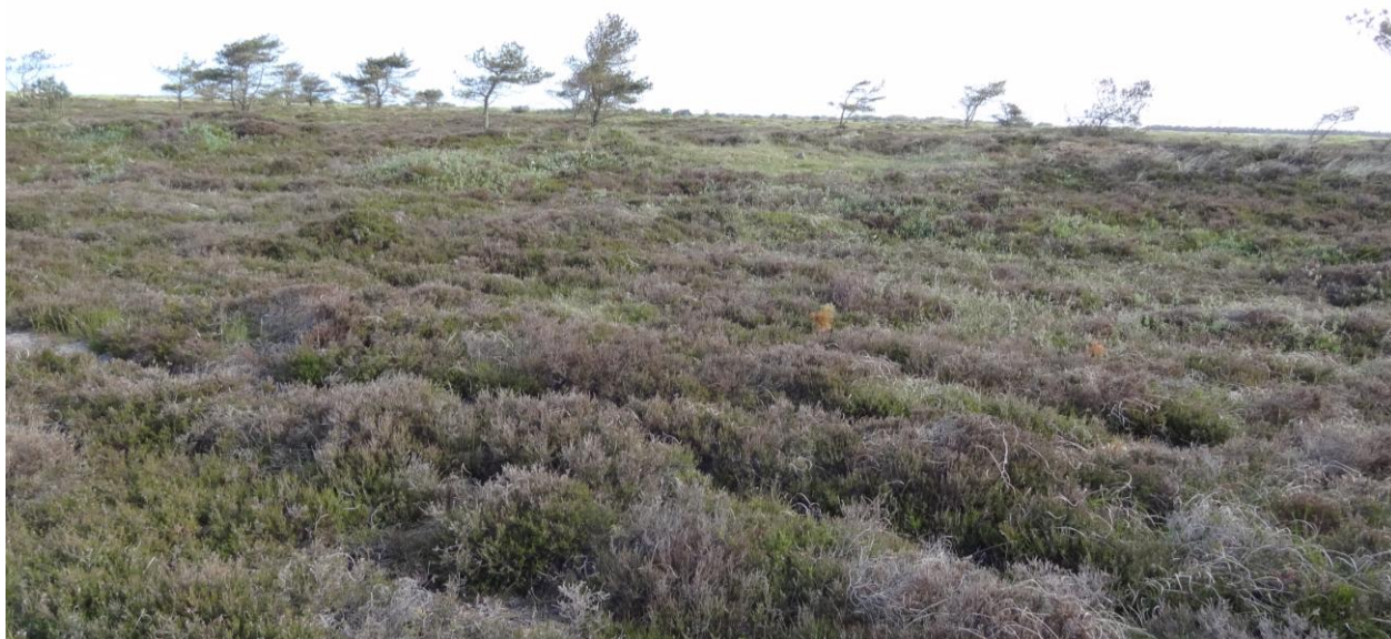
Klithede er en af de prioriterede naturtyper for Natura 2000-området.