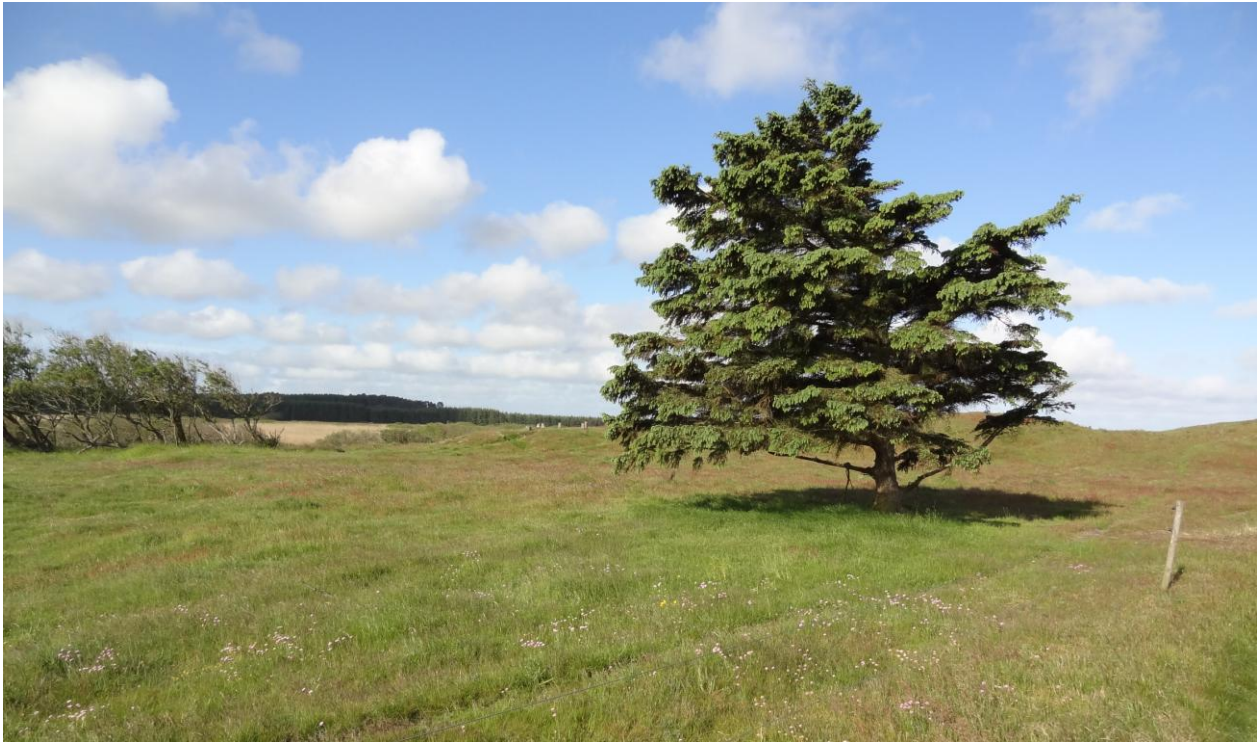
Naturpleje i form af afgræsning nord for Vullum Sø.