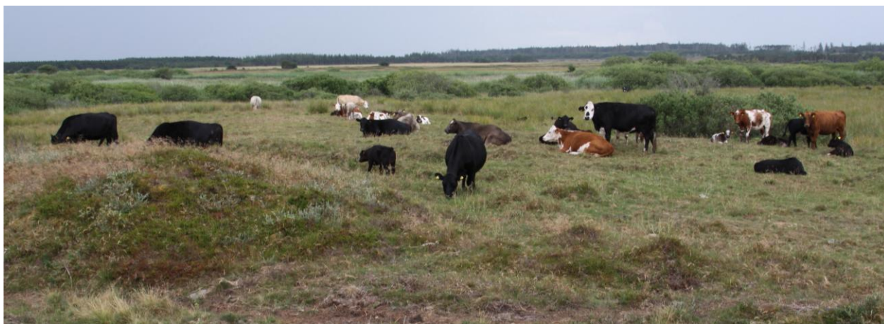
Afgræsset klithede ved Vullum Sø.

Kommunerne indgår i dialog med interesseorganisationer, som har en særlig viden om arter og naturtyper fra udpegningsgrundlaget eller gør en særlig indsats for disse i området.