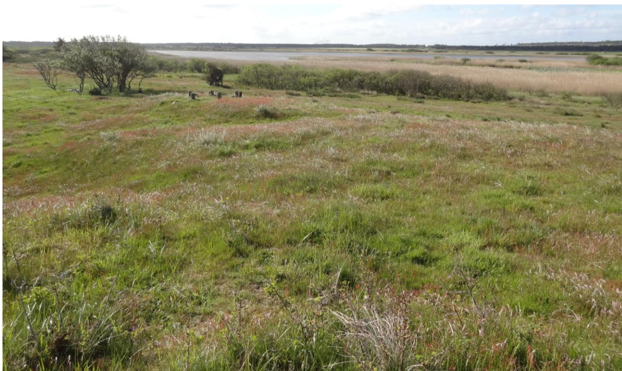
Området består af den kalkrige kransnålalge sø, Vullum Sø og et større sammenhængende klitområde omkring søen.

I handleplanen anvendes en række Natura 2000-begreber m.m., som er defineret nærmere i bilag 5.